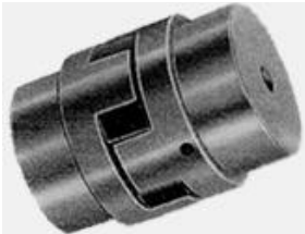
'L' Звезда Сцепные

Всеобщая звезда муфты обеспечивает быстрый и простой монтаж в поршневых насосов, генераторные установки, дизельные и газовые двигатели, и другие подобные устройства, таким образом, муфта установка не требует специальных инструментов из-за простой конструкции, в другом паука рукой является лентой и может быть достигнуто для грузового перевозчика челюсти И, таким образом, функционирует в качестве запасных паука в каждой связи.