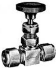
Нержавеющая сталь Игольчатый клапан

Конец Подключения: Навинчиваемая в BSP / BSPT / ДНАО резьба, розетка соединения, дважды ferrule трубы арматура.