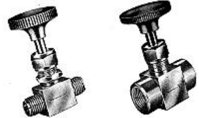
Instrumentation Игольчатый клапан

Оговорка : информация, письменные и устные предоставляются МКХ, по отношению к своей продукции, который она о пределяет, быть надежным И нет обязательств какого характера в отношении ее использования. Покупатель ВСЕОБЩЕГО бренд промышленной продукции должен определить для себя возможность использования таких продуктов.