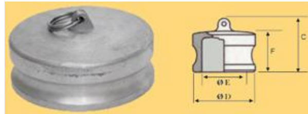
Пыль Camlock Plug