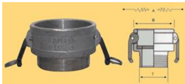
Мужчины Camlock переходник В