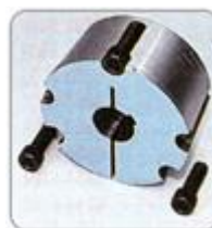
Быстрый Fit Конус-блокировка шкива Буша