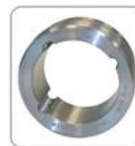
Всеобщая Weld от центра