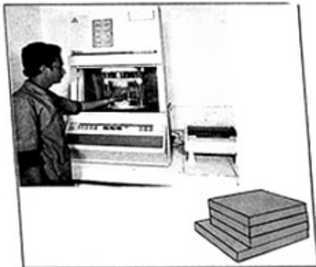
Compostos de borracha testes