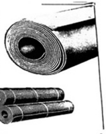
Piso mat isolamento Folhas de borracha embalado em rolos

Disclaimer: Da Informação, escritas e verbais são prestados por HIC, em relação aos seus produtos que ele determina que seja fiável e não passivos de qualquer natureza no que se refere à sua utilização. O comprador de produtos industriais UNIVERSAL marca deverá determinar por si próprio a adequação de tais produtos.