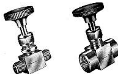
計装ニードルバルブ

免責事項 : 情報は、筆記と口頭HIC、負債には、自然の中で信頼性の高いものではないことを決定、その製品が提供されていますが相対的な使用に考えています。ユニバーサルブランドの工業製品の購入者自身のためにこのような製品の適合性を判断する必要があります。