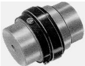
"SW" Snap Wrap Kupplung