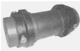
"RRS" Spacer Kupplung

Zwei Standard-Hubs, ein Kissen setzen und Kragen mit der Hardware macht gute Wahl.