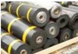
丁腈橡胶, 乙丙橡胶膜