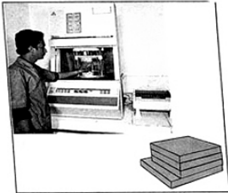
Rubber Compound Testing